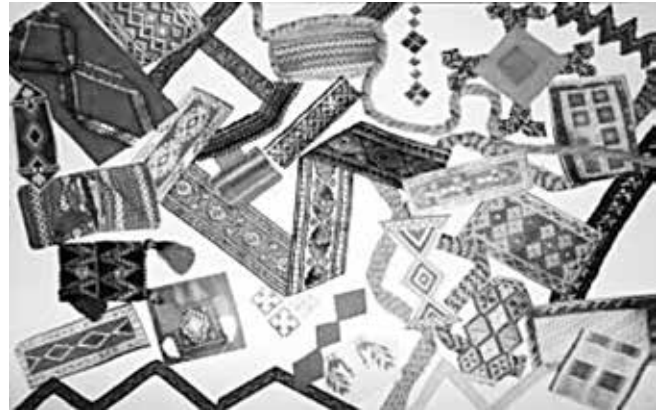
شکل ۱- استوری برد نهایی

جنس پارچه مورد استفاده در این مدل کتان انتخاب شده که با جنسیت لباس اسپرت در تطابق باشد و رنگ آن نیز با توجه به رنگ‌های موجود در گلیم و جاجیم و همچنین با سن نوجوان انتخاب شده است. از خواص رنگ سبز این است که موجب توازن و تعادل در شخصیت نوجوان میشود. رنگ زرد نیز ذهن نوجوان را باز می‌کند و موجب برانگیختگی خلاقیت می‌گردد.