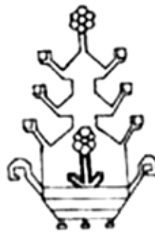
شکل ۶- موتیف الهام گرفته شده برای طراحی مدل شماره (۲)

جنس مورد استفاده با توجه به لباس اسپورت تریکو انتخاب شده و رنگ خردلی از رنگهای خانواده زرد می باشد که نشان دهنده شخصیت مثبت و زود فهمی نوجوان است و رنگ سورمه ای بدلیل تیره بودن و کسل کنندگی آن در کنار این رنگ خنثی میشود.