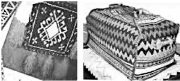
شکل ۱۰- موتیف الهام گرفته شده برای طراحی مدل شماره (۴)