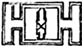
شکل ۴- موتیف الهام گرفته شده برای طراحی مدل شماره (۱)

اطلاعاتی در مورد این موضوع وهمینطور در رابطه با لباس اسپرت و تاریخچه آن بدست آورده که زمینه آگاهانه علمی خواهد بود و برای شروع کار ابتدا با استفاده از نوارهای سنتی و تزئینی و طرح‌های گلیم و جاجیم وهمینطور استفاده از پارچه‌های مورد نظر که بتوان در این موضوع استفاده کرد تهیه کرده . در ادامه استوری بردی را مشاهده می‌کنیم.