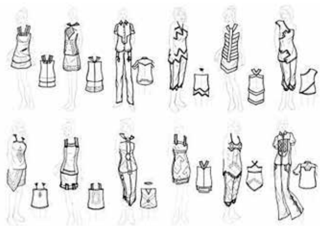
شکل ۲- نمونه اتوذهای خطی اولیه

این مدل با استفاده از برش‌های عمودی و شکسته که در نقوش سنتی (نقش سماور) دیده می‌شود طراحی شده است.