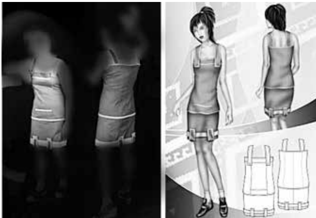
شکل ۵- اتود رنگی و دوخت نهایی مدل شماره (۱)