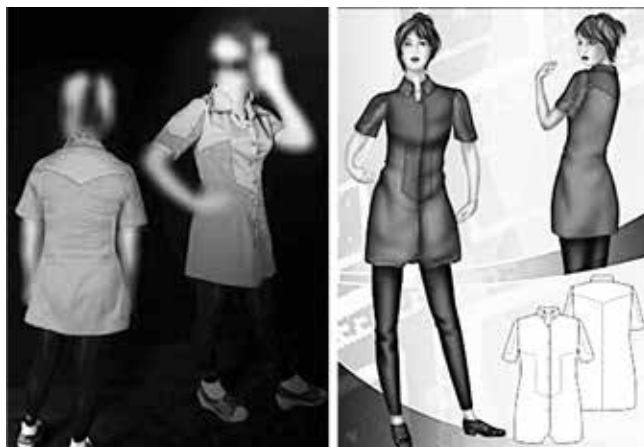
شکل ۷- اتود رنگی و دوخت نهایی مدل شماره (۲)