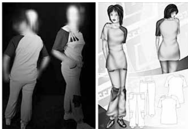
شکل ۱۳- اتود رنگی و دوخت نهایی مدل شماره (۵)