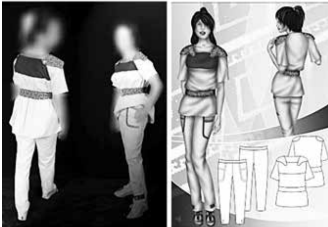
شکل ۱۱- اتود رنگی و دوخت نهایی مدل شماره (۴)