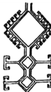
شکل ۸- موتیف الهام گرفته شده برای طراحی مدل شماره (۳)