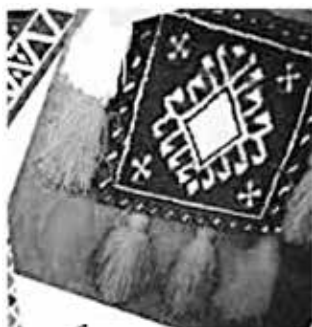
شکل ۱۲- موتیف الهام گرفته شده برای طراحی مدل شماره (۵)